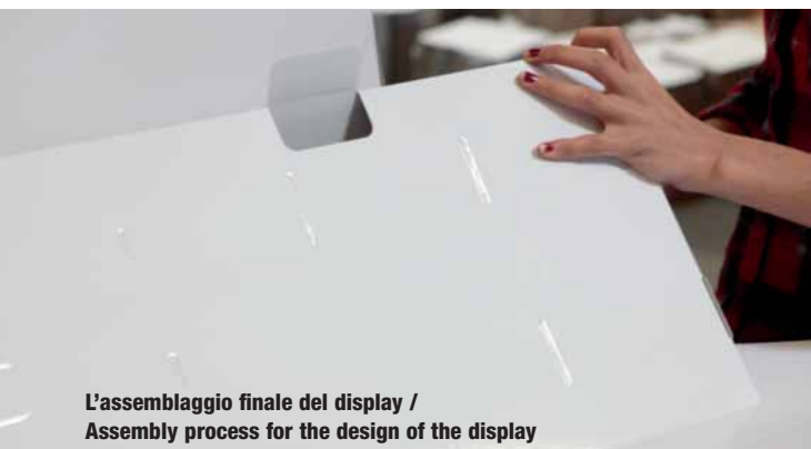
L'assemblaggio finale del display / Assembly process for the design of the display

I proprietari dei marchi, i professionisti dell'industria grafica e i trasformatori di packaging che desiderano che i loro prodotti di punta possano godere di una presentazione a elevato impatto si rivolgono senza esitazioni ai cartoncini in cellulosa Sappi realizzati in fibre vergini in quanto materiali di supporto ideali in grado di garantire la massima precisione e una qualità uniforme.